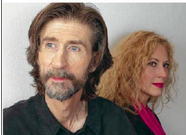
« Malgré la masse incroyable de contraintes, c'est neuf, rigolo et amusant. »

poésie Au tour de l'amour ** BIEFNOT-DANNEMARK Le Castor Astral 144 p., 15 €